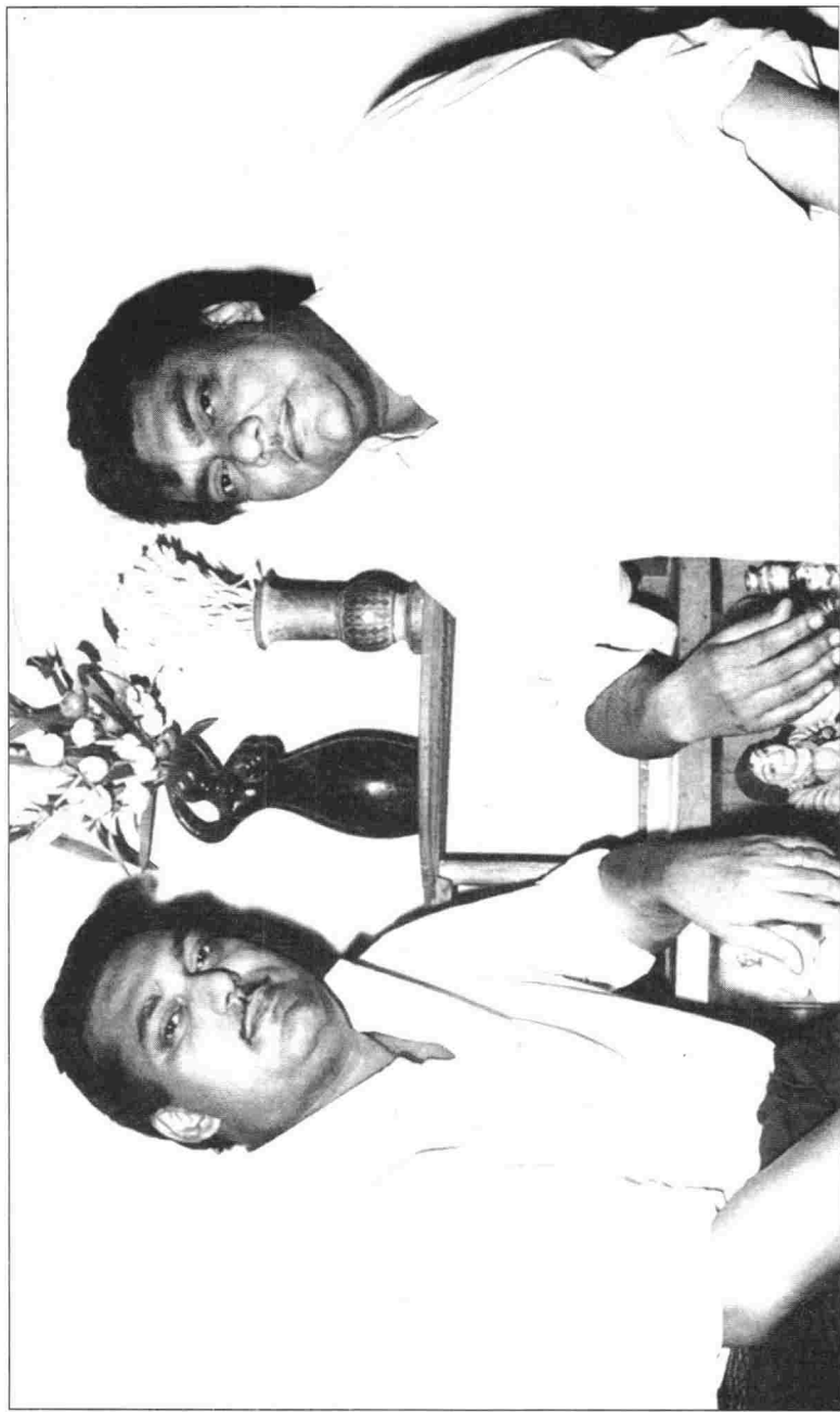
কাজী নজরুল ইসলামের দুই পুত্র : অনিরুদ্ধ এবং সব্যসাচী